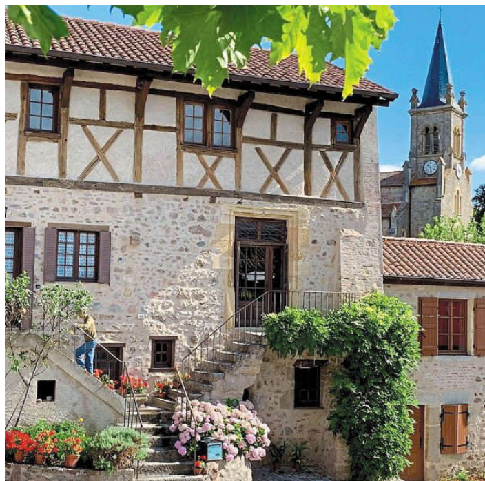
Le village du Crozet, avec sa maison de la place centrale.