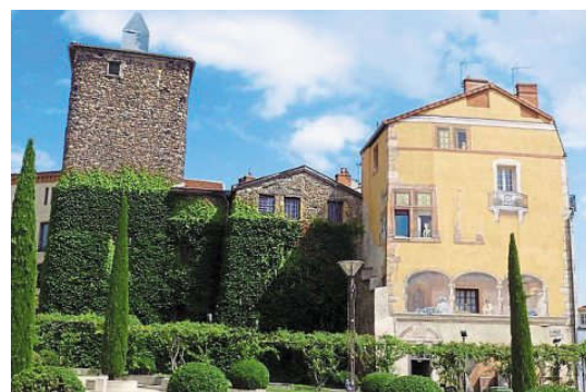
Une pause à l'estaminet du village de Saint-Haon-le-Châtel. Une vue du château de la Roche. À droite, un donjon de Roanne, une façade en trompe-l'oeil.